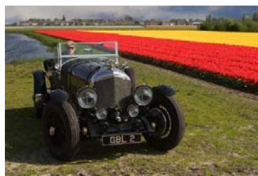
Bentley Le Mans Eight 1932